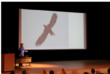
【環境学習コーナー】