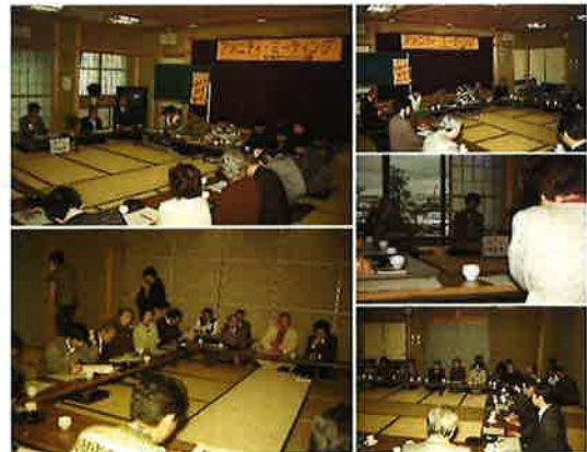
アメニティ・ミーティング