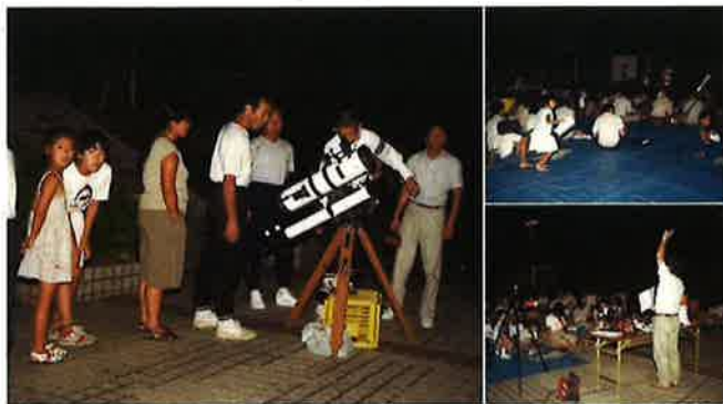
スターウォッチング(松の岩公園)