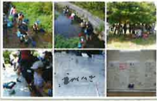
令和1年から取組開始

川の中の生き物を調べ、身近な環境に目を向け、人間だけでなく多くの生き物が棲み着き、バランスを取りながら生きていることを学び、身近な環境から地球環境まで、環境のことを考える機会を提供しています。