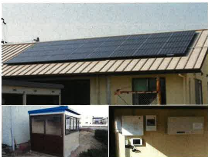
再生可能エネルギー発電事業