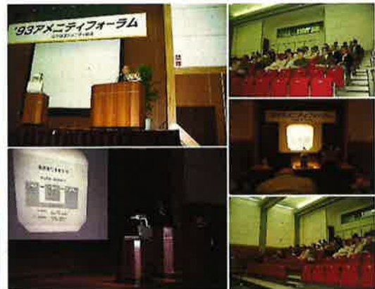
毎年3月に開催していた 「アメニティ・フォーラム」